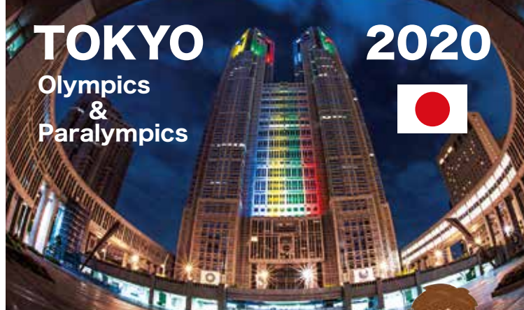
五輪色にライトアップされた東京都庁